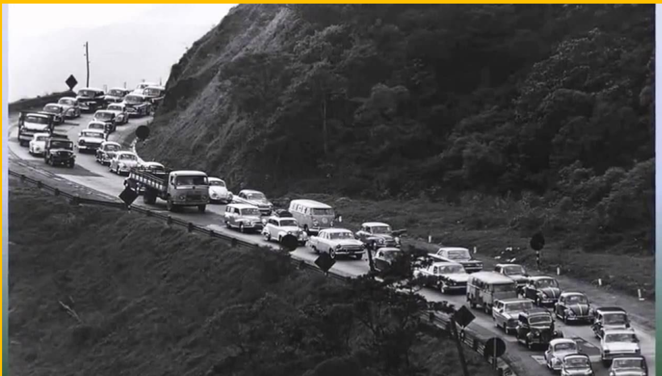
Estrada para Santos