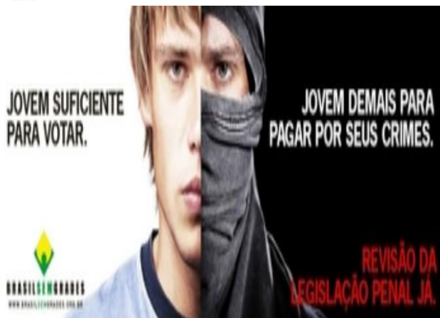
Maioridade penal nos principais países europeus